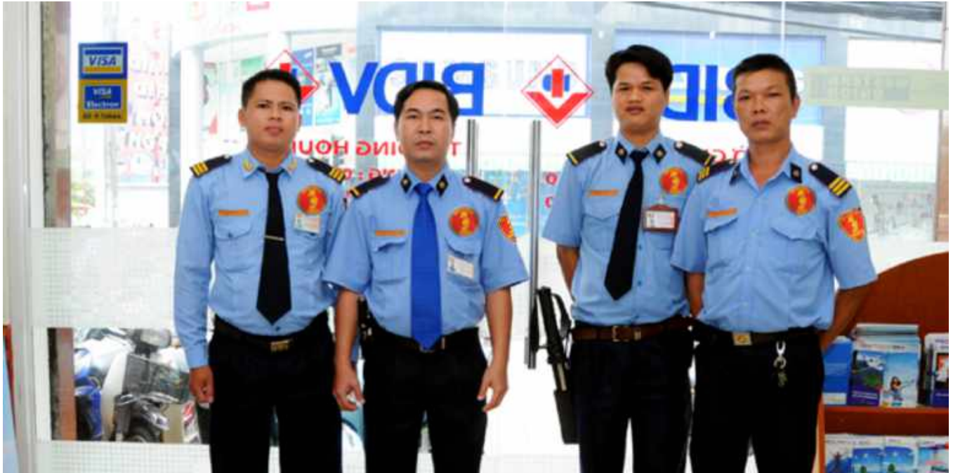
BẢO VỆ NGÂN HÀNG