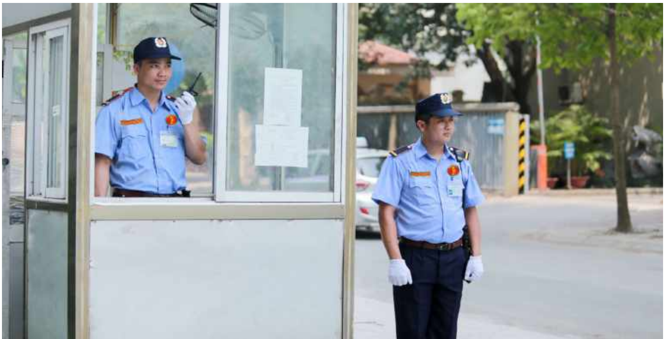
BẢO VỆ TÒA NHÀ