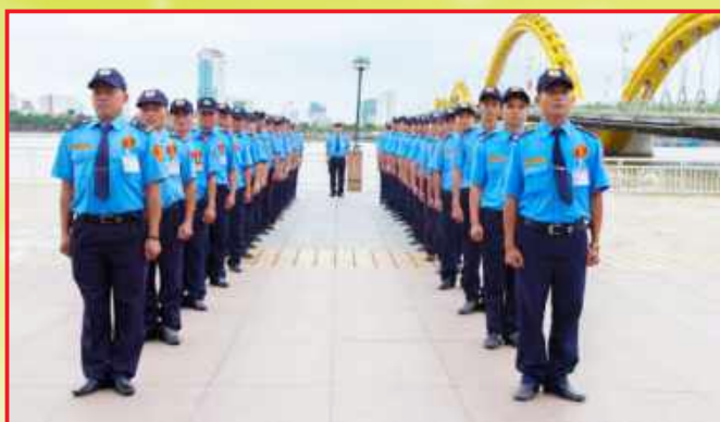
BẢO VỆ HỆ THỐNG FAMILY MART

TÙY THEO MÔ HÌNH HOẠT ĐỘNG VÀ ĐẶC THÙ CÔNG VIỆC CỦA TỪNG DOANH NGHIỆP CHÚNG TÔI SẼ LẬP PHƯƠNG ÁN TRIỂN KHAI BẢO VỆ PHÙ HỢP VÀ HIỆU QUẢ NHẤT ĐỂ ĐẢM BẢO AN TOÀN TÀI SẢN, AN NINH TRẬT TỰ VÀ CHI PHÍ TIẾT KIỆM NHẤT CHO QUÝ KHÁCH HÀNG