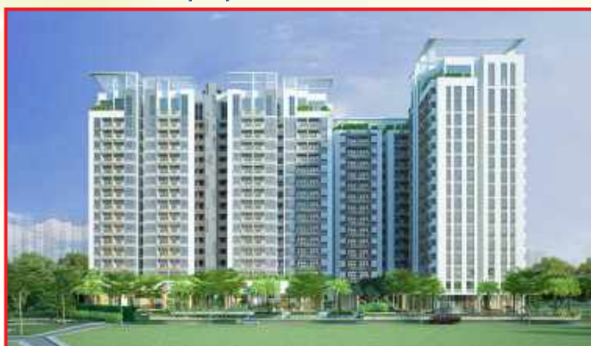
BẢO VỆ CHUNG OPAL GARDEN