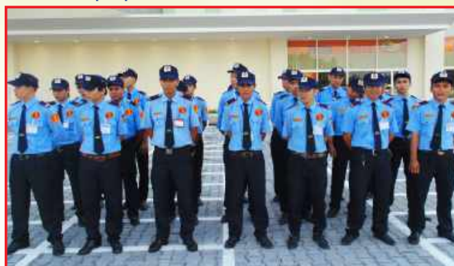
BẢO VỆ TRUNG TÂM THƯƠNG MẠI BIG C MIỀN ĐÔNG