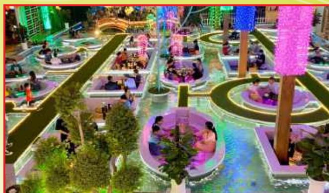
BẢO VỆ HỘ KINH DOANH KOI FAMILY COFFEE